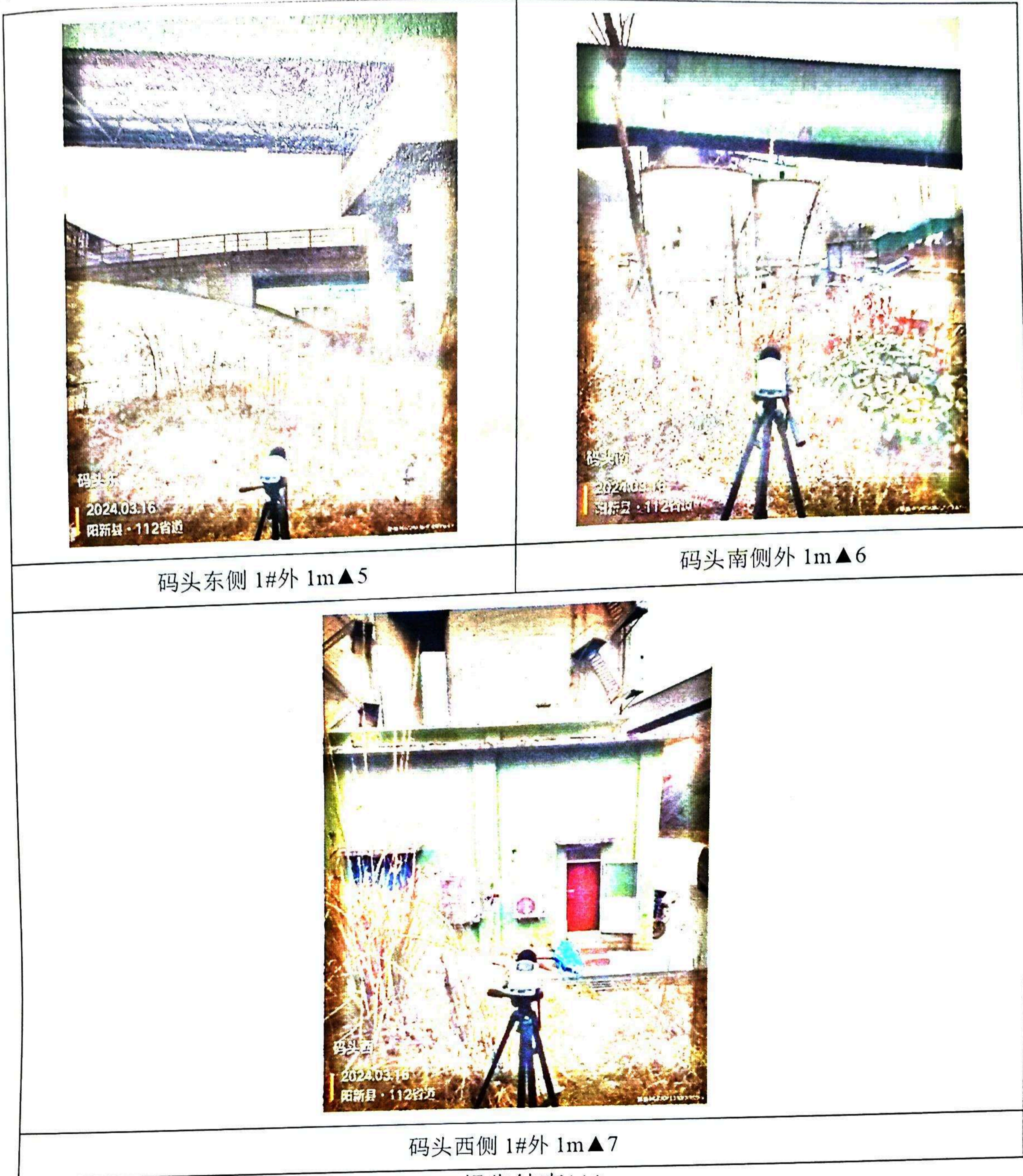
码头东侧 1#外 1m▲5